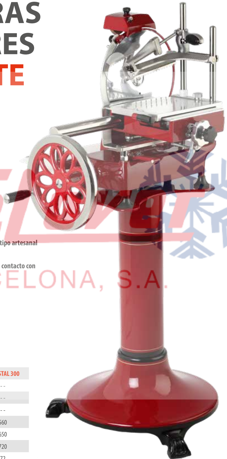
Mod. 300 vol con soporte y volante florado (opcional)